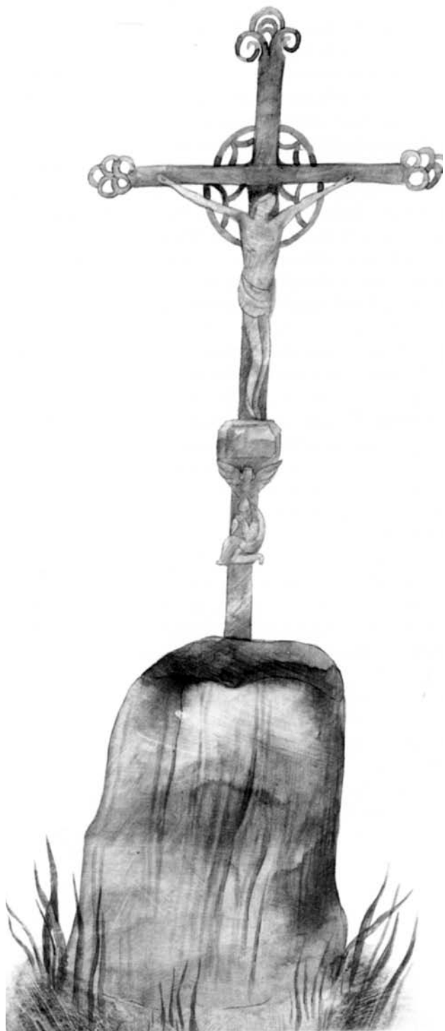
ALENA WAGNEROVÁ / H. Košková: Poludnica z Čerepeša